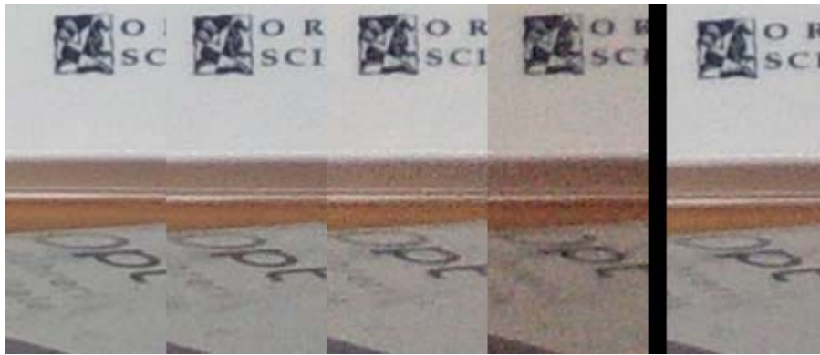
Von links nach rechts: ISO 50, 100, 200, 400, Auto 1:1-Ausschnitte, Originalfotos 2304x1728 Pixel, ***