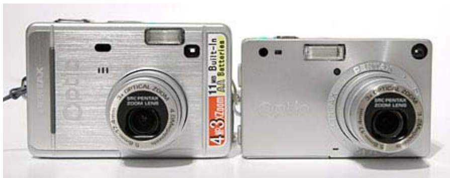
Optio S40 ( links ) neben der OptioS

Mit ihrer Baugröße sorgt auch die S40 teilweise noch für erstaunte Blicke, das aber nicht so deutlich wie z.B. bei der OptioS/S4, wenn man sie aus einer Bonbondose nimmt und damit fotografiert. Da sind wir auch schon bei einem kleinen "Nachteil" der Kamera... Wobei eine Größe von 89 (B) x 58,5 (H) x 25,5 (T) mm (ohne vorstehende Teile) und ein Gewicht von 175g betriebsbereit (125g ohne Akkus/Karte) natürlich immer noch wirklich gut sind.