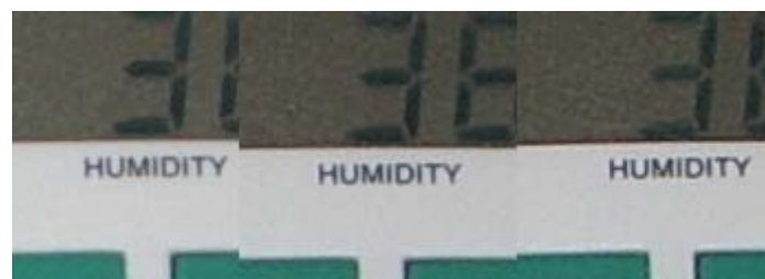
Von links nach rechts: Schärfe -1, 0, +1 1:1-Ausschnitte, Originalfotos 2304x1728 Pixel, ***

Wie man an diesen Ausschnitten sieht, bleibt das Bildrauschen bei ISO 50 noch relativ niedrig und ist auch bei ISO 100 akzeptabel. Bei ISO 200 stößt man allerdings schon an die Grenze und vor allem in dunkleren Bildbereichen macht sich das Rauschen störend bemerkbar. Als unbrauchbar stupe ich wie bei praktisch allen kleinen Kameras den ISO 400-Modus ein - es gibt vielleicht Situationen, in denen man nur noch mit ISO 400 verwacklungsfreie Fotos machen kann (wenn z.B. Blitzen verboten ist), aber dann muss man schon große Qualitätseinbußen in Kauf nehmen, Fotos mit ISO 200 lassen sich dagegen z.B. noch gut auf Standardfotoformate vergrößern.