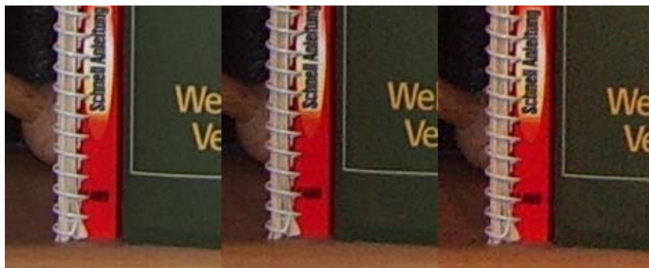
Von links nach rechts: ISO 50, 100, 200 1:1-Ausschnitte, Originalfotos 2304x1728 Pixel, ***

Wie man an diesen Ausschnitten sieht, bleibt das Bildrauschen bei ISO 50 noch relativ niedrig und ist auch bei ISO 100 akzeptabel. Bei ISO 200 stößt man allerdings schon an die Grenze und vor allem in dunkleren Bildbereichen macht sich das Rauschen störend bemerkbar. Als unbrauchbar stupe ich wie bei praktisch allen kleinen Kameras den ISO 400-Modus ein - es gibt vielleicht Situationen, in denen man nur noch mit ISO 400 verwacklungsfreie Fotos machen kann (wenn z.B. Blitzen verboten ist), aber dann muss man schon große Qualitätseinbußen in Kauf nehmen, Fotos mit ISO 200 lassen sich dagegen z.B. noch gut auf Standardfotoformate vergrößern.