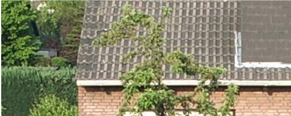
1:1-Ausschnitt aus einem Foto mit 2304x1728 Pixel, *** ISO 50, Schärfe 0, Kontrast 0, Farbsättigung 0 Aufgenommen bei 35 mm Brennweite (äquiv. Kleinbild)

Schärfungsartefakte z.B. an harten Übergängen sichtbar werden. Aber welche Einstellung optimal ist, muss jeder für sich selbst herausfinden - am besten mithilfe einiger Testaufnahmen für Schärfe, Kontrast und Farbsättigung.