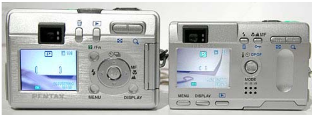
Optio S40 ( links ) neben der OptioS

Wer die Vorgängermodelle der S40 kennt, wird bei ihr in der Geschwindigkeit keine großen Überraschungen erleben. Der Serienbildmodus schafft in der 3 Megapixel-Auflösung 1 Bild/sek bis die Karte voll ist, in voller Auflösung nimmt die Geschwindigkeit entsprechend ab, immer abhängig von der verwendeten Karte, dem Aufnahmemotiv und den gewählten Kameraeinstellungen (Schärfe, Kontrast, ISO-Empfindlichkeit usw.).