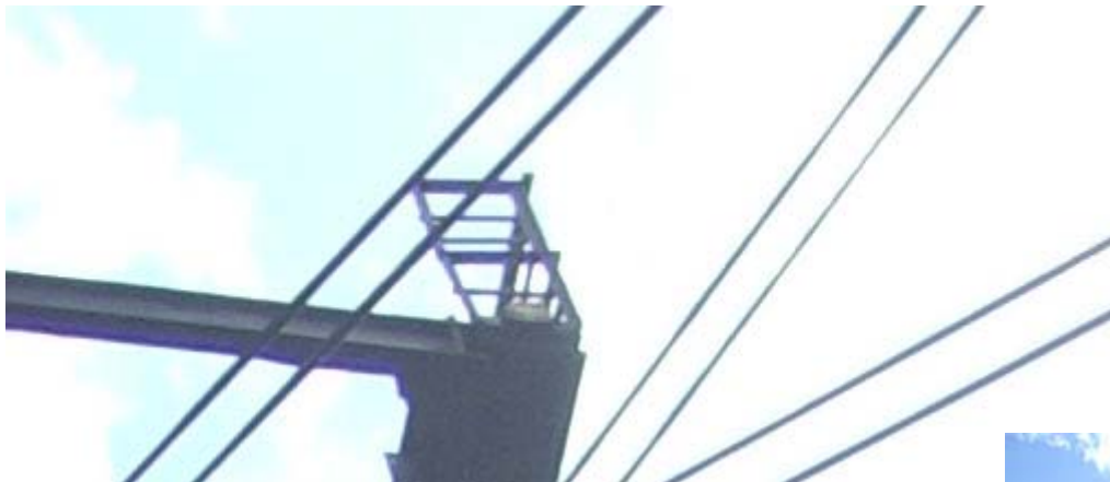
1:1-Ausschnitt aus einem Foto mit 2304x1728 Pixel, ** ISO 50, Schärfe 0, Kontrast 0, Farbsättigung 0, Belichtungskorrektur +0.3 EV Aufgenommen bei 35 mm Brennweite (äquiv. Kleinbild)

Verschiedene Tests sagen, dass die Auflösungsleistung des Objektivs im üblichen Bereich für kleine 4 Megapixel-Kameras liegt, aber rein subjektiv scheint mir die Auflösungsgrenze erreicht. Dementsprechend ist natürlich auch die bis auf die Auflösung baugleiche Optio S30 eine Überlegung wert, günstiger zu bekommen ist diese aber auch kaum. Die Bildschärfe von Aufnahmen der S40 wird also sicher niemandem "vom Hocker reißen", wenngleich sie für normale Hobbyfotografen eigentlich ausreicht.